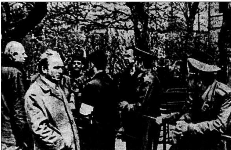
Сахаров не пропускал ни одного политического суда и целыми днями вместе с друзьями и близкими простаивал у закрытых дверей "открытых" процессов Во время суда над Ю.Ф.Орловым

Солженицын, к примеру, призывая к созданию "жертвенной элиты", писал: "Ян Палах сжег себя. (Этот поступок он совершил в 1969 году в знак протеста против оккупации ЧССР войсками СССР и его сателлитов. - В.Б.) Если бы она (эта жертва) была бы не одинокой, она бы сдвинула Чехословакию" ("Из-под глыб").