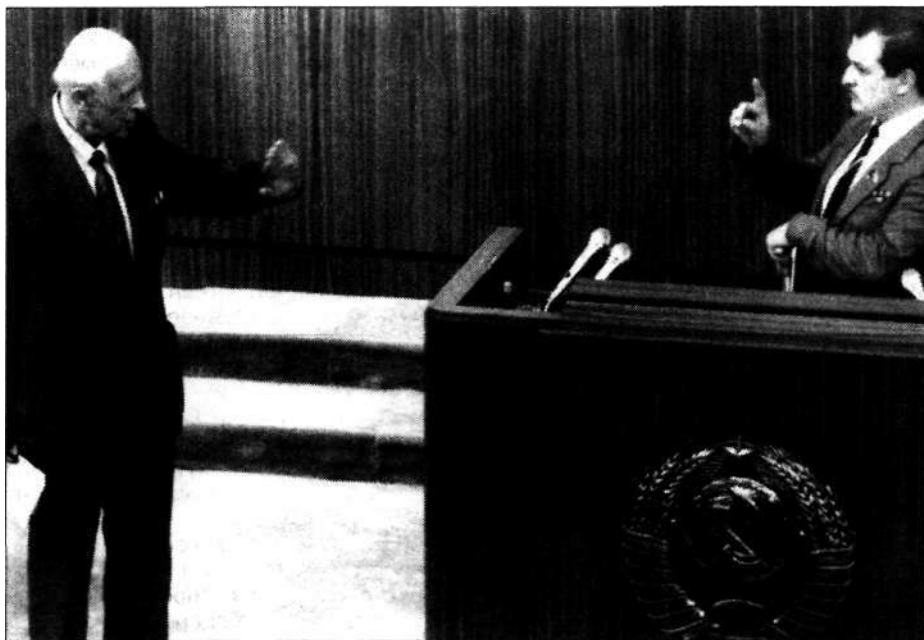
Андрей Дмитриевич был энтузиастом парламентаризма и блестяще демонстрировал его возможности своими выступлениями на Съезде народных депутатов СССР

Эту мысль в том же сборнике под-держивал и развивал единомышленник Солженицына академик Игорь Шафаревич: "Самое существенное для спасения России может быть сделано лишь на единственном пути - через жертву! ...Если до готовности к жертве поды-мутся не только единицы, это очистит души, взрыхлит почву, на которой может взрасти религия. Жертва может дать силы, чтобы преодолеть многие препят-ствия, стоящие на пути России!"